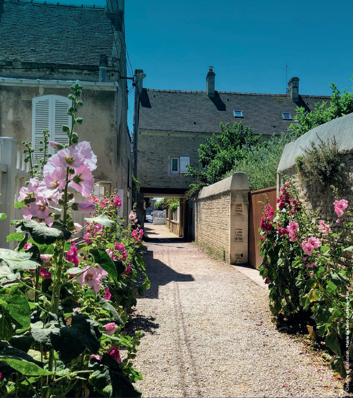
Création et réalisation : Mairie de Saint-Aubin-sur-Mer