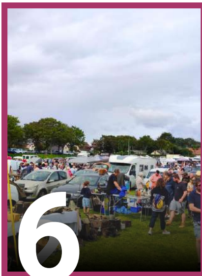
CULTURE / ANIMATIONS