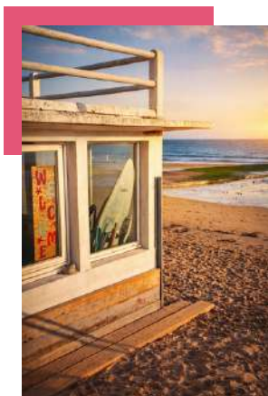
@ Can'dice Candice Facebook groupe : Saint-Aubin-sur-Mer, la Reine de l'Iode - Photos / Vidéos