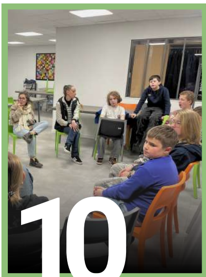
ENFANCE / JEUNESSE