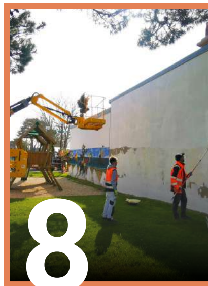
TRAVAUX / URBANISME